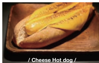
/ Cheese Hot dog /