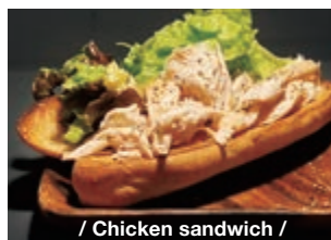
/ Chicken sandwich /