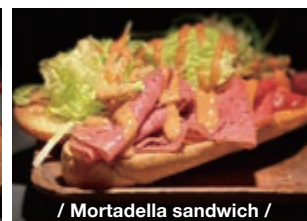
/ Mortadella sandwich /